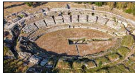
Anfiteatro Romano di Siracusa

- Ultimo viaggio dell'anno sarà dal 3 all'8 di ottobre, nella Sicilia Sud-Orientale. La splendida Sicilia ci accoglierà come sempre, con i suoi paesaggi, i suoi colori, i suoi profumi, la sua storia, la sua cultura e non da ultimo la sua meravigliosa cucina mediterranea. Vedremo l'imponente Catania, situata sotto le falde del più grande vulcano d'Europa, sua maestà l'Etna. Ci sposteremo nella Magna Grecia visitando Siracusa, per proseguire verso Noto capitale del barocco siciliano e poi Ragusa e il suo