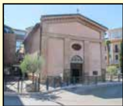
La Chiesa di S. Rocco