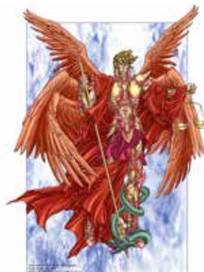
Seven Spirit of God, San Michele Arcangelo

"Lavorando su commissione, realizziamo illustrazioni per libri, copertine e anche ritratti e dipinti in stile classico. Inoltre, in questo momento, stiamo disegnando un fumetto ambientato nella Roma di Cesare, ma siamo appena all'inizio, la strada è ancora lunga prima di giungere alla sua conclusione, ma non certo priva di entusiasmo".