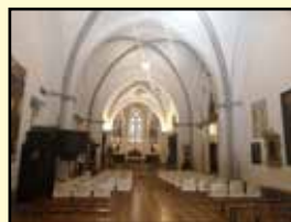
L’interno della Chiesa di Santa Croce