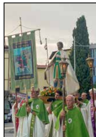
La processione per le vie di Bastia