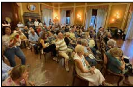
Il numeroso pubblico in sala