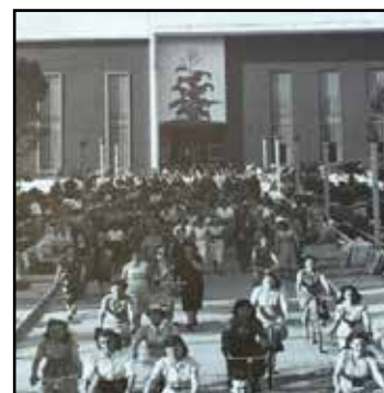
Le tabacchine all'uscita dello stabilimento