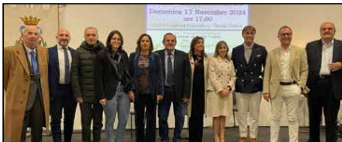
Un momento della cerimonia finale dell'Insula Romana 2024

“Sì, abbiamo come sempre diverse categorie. Oltre alla Narrativa edita e alla Poesia inedita, ci sono riconoscimenti speciali: il Premio Roberto Quacquarelli per la pittura, in memoria dell'artista ed ex presidente della Pro Loco; il Premio alla Cultura che nel 2024 è stato assegnato a Brunello Cucinelli, esempio straordi-