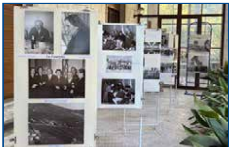
La mostra fotografica