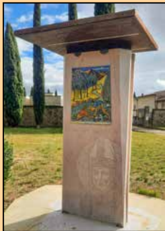
L'opera realizzata dal Comitato San Rufino di Costano e posta accanto al cimitero locale

Il primo vescovo di Assisi fu martirizzato proprio a Costano e fu annegato con una pietra al collo