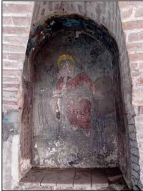
L'antico dipinto prima e dopo l'intervento di restauro